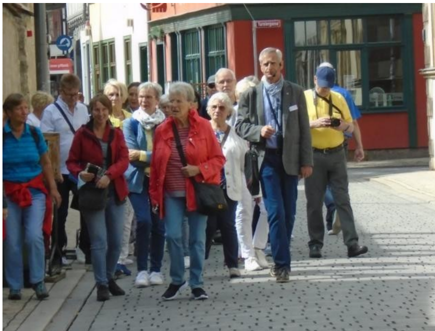
STADTRUNDGANG IN ERFURT