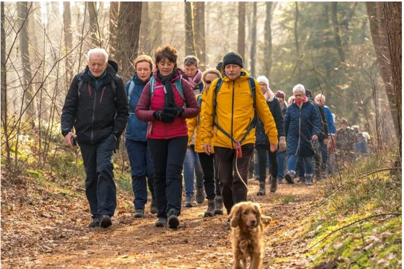
Etappenwanderung bei Börger