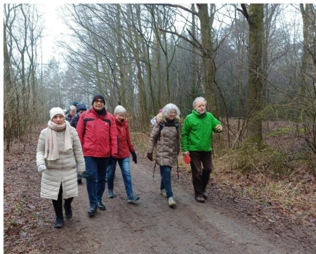
Vormittagswanderung in Hauenhorst